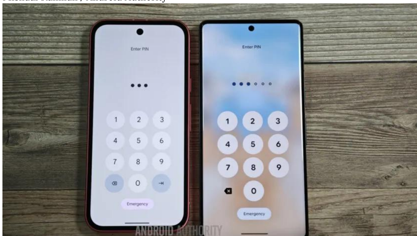
Mishaal Rahman / Android Authority