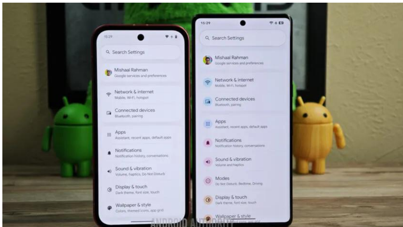
Mishaal Rahman / Android Authority