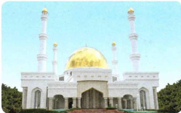
2024-nji ýylyň Oraza aýynda Balkan welaýaty boýunça agyz beklenýän we açylýan wagtlar