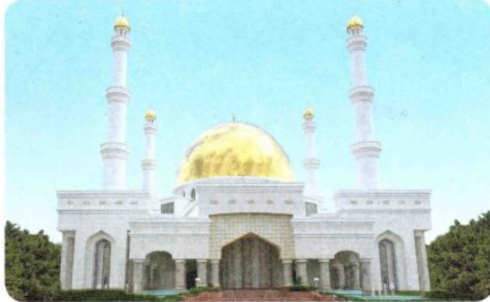
2024-nji ýylyň Oraza aýynda Aşgabat şäheri hem-de Ahal welaýaty boýunça agyz beklenýän we açylýan wagtlar