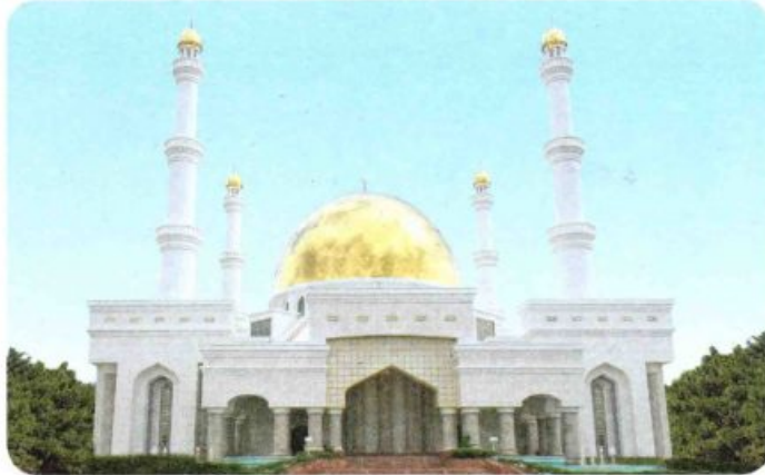
2024-nji ýylyň Oraza aýynda Mary welaýaty boýunça agyz beklenýän we açylýan wagtlar